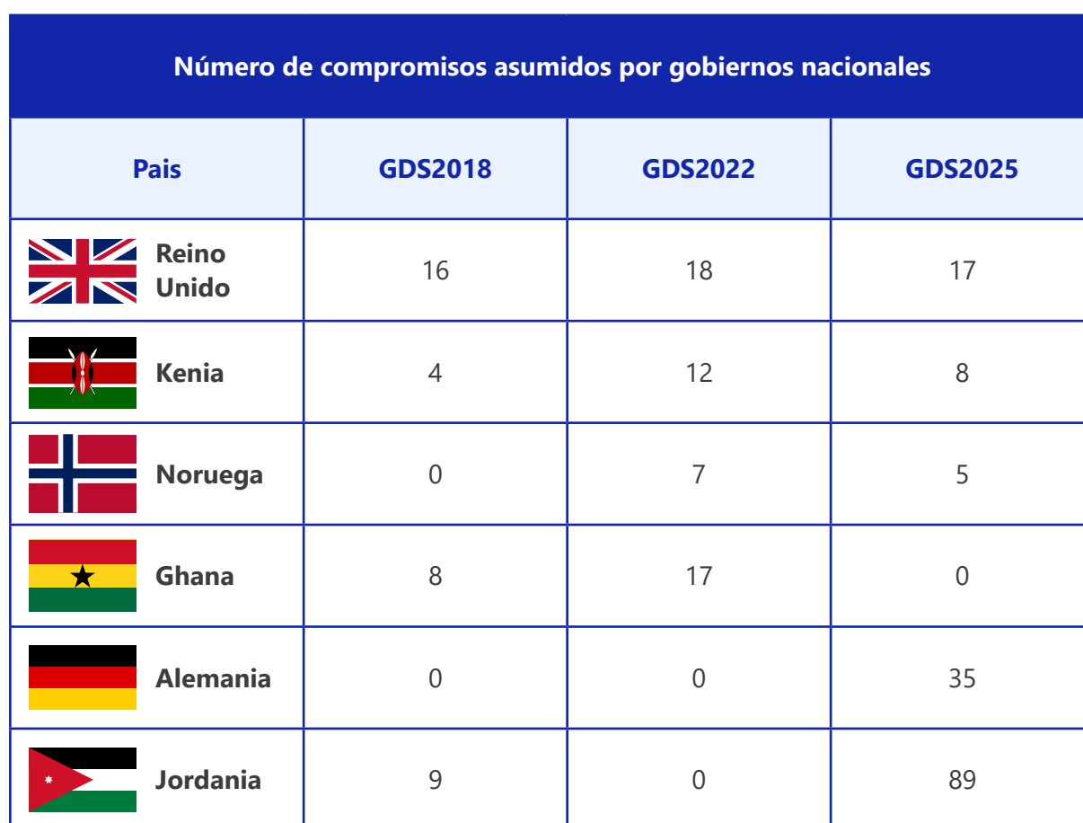
Ilustración 4: Número de compromisos asumidos por los gobiernos anfitriones en cada Cumbre

Coorganizar la GDS no solo señala el compromiso de un gobierno con la equidad social y demuestra sus valores al ayudar a elevar a la comunidad de la discapacidad, la coorganización también parece ayudar a impulsar los esfuerzos nacionales para promover los derechos de las personas con discapacidad.