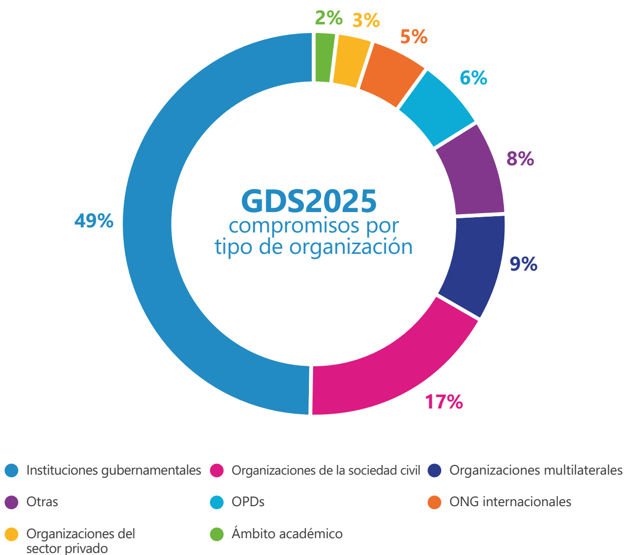
Ilustración 2: Resumen de los compromisos de la GDS2025 por tipo de organización

a nivel nacional. Casi una cuarta parte (n.85) de los compromisos de la GDS2025 asumidos por instituciones gubernamentales involucraron compromisos asumidos por gobiernos del Norte Global para fortalecer los derechos y la inclusión de la discapacidad en el Sur Global. Los compromisos restantes de la GDS2025 (n.18) por parte de instituciones gubernamentales involucraron cooperación Sur Global/Sur Global y compromisos de instituciones gubernamentales para fortalecer los derechos y la inclusión de la discapacidad a través de organizaciones multilaterales. De los compromisos restantes de la GDS2025, el 17 % (n.139) de todos los compromisos fueron asumidos por organizaciones de la sociedad civil, el 9 % por organizaciones multilaterales (n.71), el 8 % por entidades «diversas» (n.67), el 6 % (n.52) por OPD, el 5 % (n.40) por OING, el 3 % (n.27) por organizaciones del sector privado, y el 2 % (n.20) por instituciones académicas. Los compromisos restantes de la GDS2025 fueron asumidos por tipos de organizaciones no clasificadas. La Ilustración 2 presenta el porcentaje de compromisos de la GDS2025 por tipo de organización.